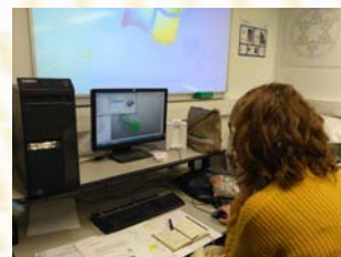
Conception assistée par ordinateur.