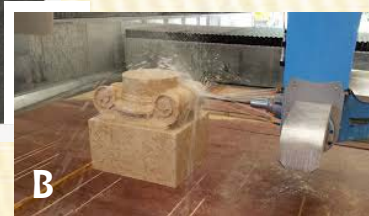
Fabrication assistée par ordinateur